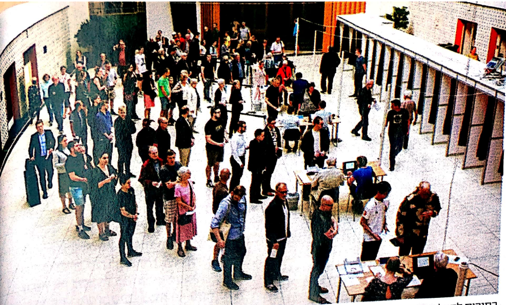
בחירות לפרלמנט בקובנהגן, יוני 2019

"בשלב מסוים לא יהיו גבולות - כי אי אפשר למוע מעבר של אנשים. לכן אני משקיעה כל כך בחיפוש פתרונות פיננסיים לערים. אני מאמינה שבסוף זה יהיה עולם של מגה-ערים ושצריך למצוא את הדרכים ליצור ערים שמתמודדות עם כל הצרכים של התושבים שלהן"