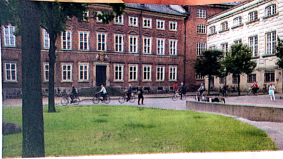
משרד האוצר הדני בקופנהגן

20% מהתושבים הדנים גרים בדיור ברהשגה. הבניינים והדירות הנבנים עבור "דיור חברתי" אינם ממומנים מכספי מסים, אלא נבנים כחלק ממנגנון שמעורבים בו קואופרטיבים גדולים, קרנות הפנסיה וגם הממשלה והממשל המקומי. כ-30% מכל פרויקט בנייה מוקצים לדיור ברהשגה או לדיור ציבורי